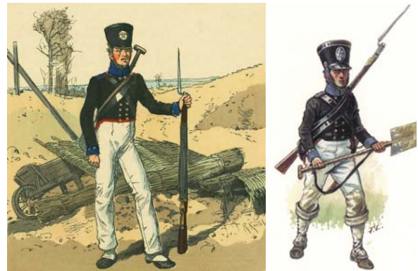
Pioniere des Mansfelder Pionierbataillons

In den Kriegsberichten sind Ingenieure und Pioniere häufig mit Anerkennung genannt. Sie hatten wesentlichen Anteil an den Erfolgen des Armeekorps. Es hatte sich aber auch gezeigt, dass die Pioniertruppe im Verhältnis zur Gesamtarmee zu schwach war. Die Verstärkungen vom Sommer 1814 konnten das nicht ausgleichen. Aus Mangel an Pionieren sah sich Blücher 1815 genötigt, für die Operationen Gegenden auszusuchen, die an Wasserläufen ärmer waren als die des Feldzuges im Vorjahr. Ein – außerhalb der Pionierwaffe liegender – Missetand ist darin zu sehen, dass sich die Truppenführer in der kurzen Friedensperiode das Wissen um den rechten Ansatz von Pionierkräften noch nicht angeeignet hatten. Es wird berichtet, dass sich nur beim Yorckschen Korps im Feldzug 1814 eine Pionierkompanie bei der Avantgarde, die andere bei der Reserve befand. Bei den übrigen Korps sind die Pioniere beim Marsch in der Regel der Reserveartillerie zugeteilt worden.