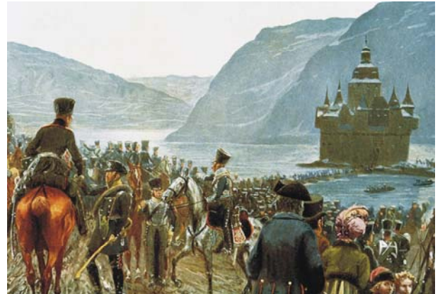
Rheinübergang bei Kaub

Den 4. Januar vereinigen sich die Korps dergestalt, dass das Korps von Sacken bei Alzey eintrifft und Neustadt, Dürkheim und Speyer mit Detachements besetzt, auch gegen Mainz Kavallerie poussiert; die Korps von Langeron und von Yorck treffen bei Kreuznach ein und schicken ebenfalls Kavallerie gegen Mainz vor. Durch Kavallerie-Detachements, welche von beiden Seiten abgeschickt werden und sich zwischen Kreuznach und Alzey begegnen, werden gegenseitig die Nachrichten vom Eintreffen gegeben; sobald der Übergang bewerkstelligt ist, wird jedoch schon ein Courier von beiden Seiten über Frankfurt die Nachricht davon bringen. Ich werde mich bei den Korps von Langeron und von Yorck aufhalten.