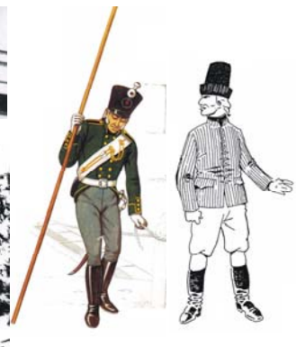
Leinwandponton, Brückenbau, russische Pioniere in Dienst- und Arbeitsuniform

Am 31. Dezember gegen 4 Uhr nachmittags traf Blücher in Kaub ein. Der Anmarsch der Truppe vollzog sich Brigadeweise von Weisel herab durch das enge Tal nach Kaub zu. Der